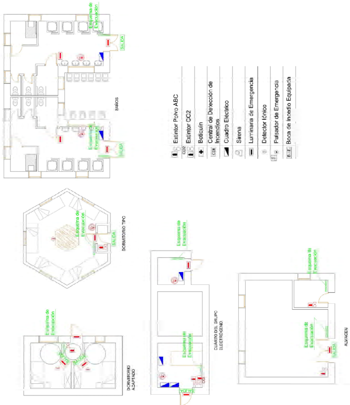
Fig. 2.- Plano cabañas